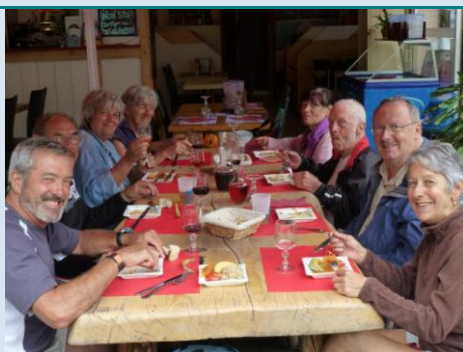
Ambiance chaleureuse au restaurant La Taverne à Thonon