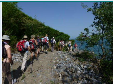
Sur le sentier des Bacounis le long du lac Léman