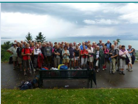
La pluie du dimanche n'a pas altéré la bonne humeur