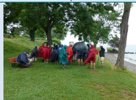
Les capes de pluie sont de sortie...

Pour tout complément d'information contacter :