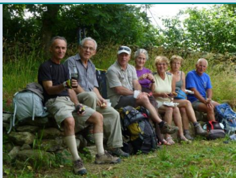
Une belle brochette de pèlerins...